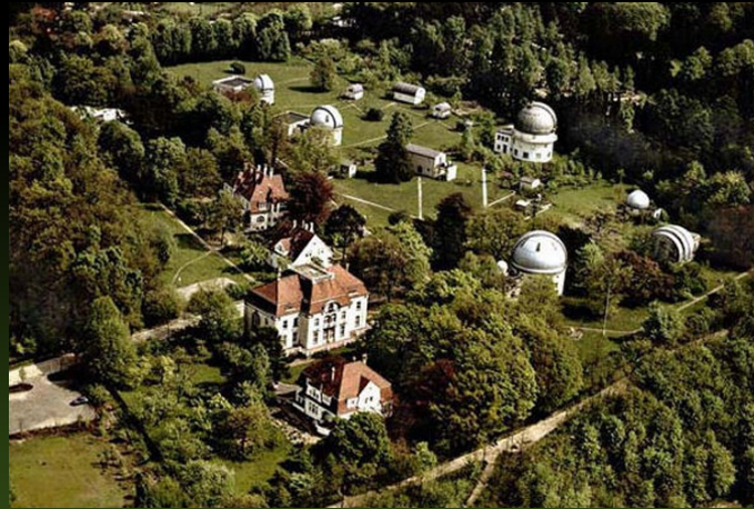
Hamburger Sternwarte in Bergedorf (1960)

Förderverein Hamburger Sternwarte e.V. Gojenbergsweg 112, 21029 Hamburg Eingang: August-Bebel-Straße 196