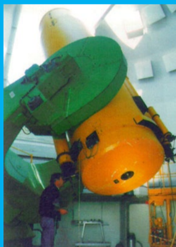
Großes Schmidt-Teleskop

„ Sterne über Hamburg “, Poster-Ausstellung im Hauptgebäude