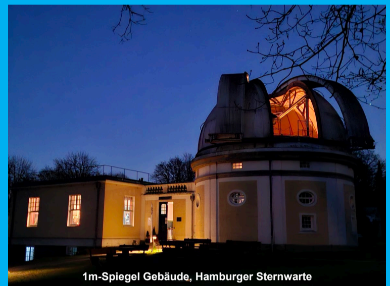
1m-Spiegel Gebäude, Hamburger Sternwarte