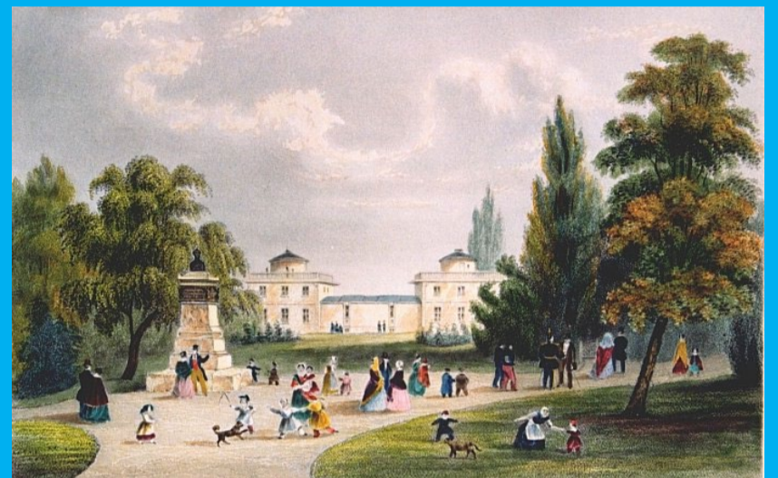
Hamburger Sternwarte am Millerntor (*1825)

„Sterne über Hamburg“, Poster-Ausstellung im Hauptgebäude