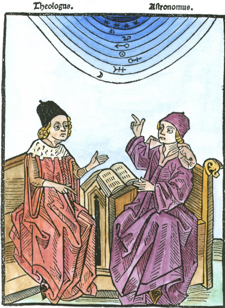
Abbildung 0.1: Theologe und Astronom im Disput – Pierre d’Ailly (1350–1420): Concordantia astronomiae cum theologia (Venedig 1490).

© Adam McLean (AST15, Holzschnitt, kolloriert), http://www.levity.com/alchemy/amcl_astronomical_material.html