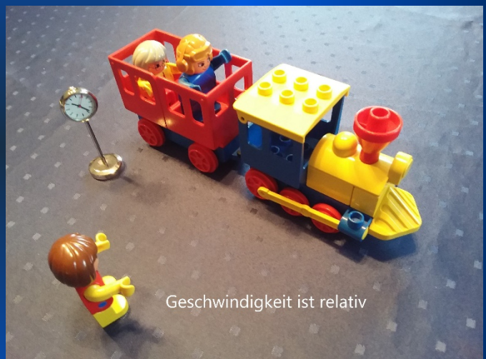
Geschwindigkeit ist relativ

In der Antike stellte man sich die Frage, ob das Licht unendlich schnell sei oder nicht. Jahrhunderte später begann mit Galilei die Zeit, in der man ernsthaft die Geschwindigkeit zu messen begann. Römer, Fizeau u.a. näherten sich dem Wert von c mittels direkter Messmethoden, bis beim Doppelspaltexperiment von Young die Frage nach der Natur des Lichtes aufkam: Teilchen oder Welle? Unter Nutzung des Wellenmodells stießen Michelson und Morley auf die Konstanz der Lichtgeschwindigkeit, die Einstein in seiner speziellen Relativitätstheorie zu erklären vermochte. Und schließlich muss noch Maxwell erwähnt werden, der das (sichtbare) Licht einbettete in die Gesamtheit der elektromagnetischen Wellen.