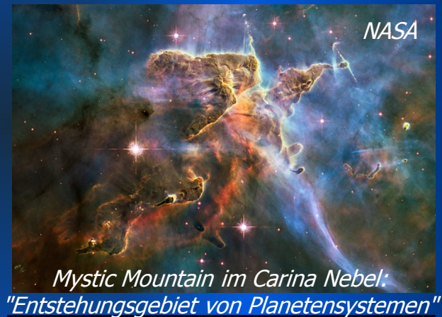
Mystic Mountain im Carina Nebel: "Entstehungsgebiet von Planetensystemen"

Mittlerweile wurden mehr als 1000 Planeten außerhalb unseres Sonnensystems entdeckt. Mit der Entdeckung dieser extrasolaren Planeten bestärkt sich die Annahme, dass die Mehrzahl der Sterne in der Milchstraße von Planeten begleitet werden, also Teil sogenannter Planetensysteme sind. Aber wie entstehen solche Planetensysteme? Obwohl sich Forscher seit Jahren intensiv mit dieser Frage auseinandersetzen, gibt es noch heute mehr Rätsel als Antworten. In diesem Vortrag erhalten Sie Einblicke in das spannende und äußerst aktive Forschungsgebiet der Planeten- und Sternentstehung, wobei hoffentlich auch einige Ihrer brennenden Fragen beantwortet werden.