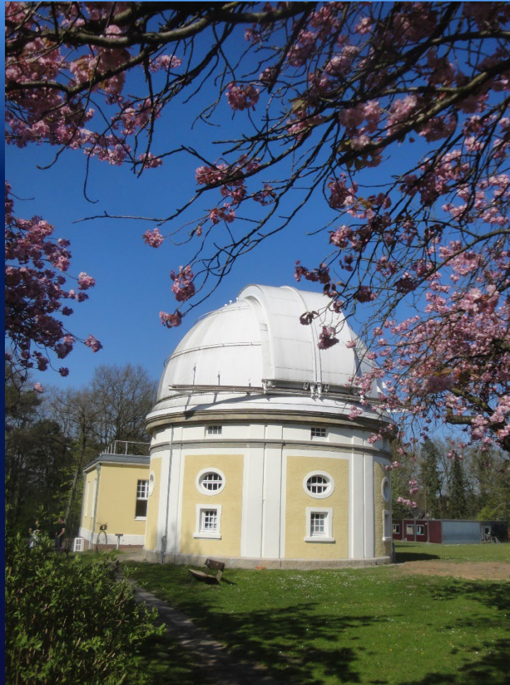
1m-Spiegelteleskop-Gebäude der Hamburger Sternwarte in Bergedorf, FHS: Sanierung 2008-2010, Restaurierung 1m-Spiegelteleskop (2011/12)

Am 23.1. 1998 wurde der „Förderverein Hamburger Sternwarte e.V.“ gegründet, um das Kulturdenkmal zu erhalten („ wissenschaftliche und volksbildende Nutzung, öffentliches Interesse wecken und finanzielle Mittel zum Erhalt des Ensembles einwerben “). Für sein Engagement, besonders bzgl. der Sanierungsarbeiten, wurde der Förderverein 2006 mit dem Deutschen National-Preis für Denkmalschutz ausgezeichnet. 2008 wurde die Sternwarte als Kulturdenkmal von nationaler Bedeutung eingestuft.