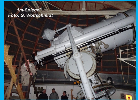
1m-Spiegel, Foto: G. Wolfschmidt