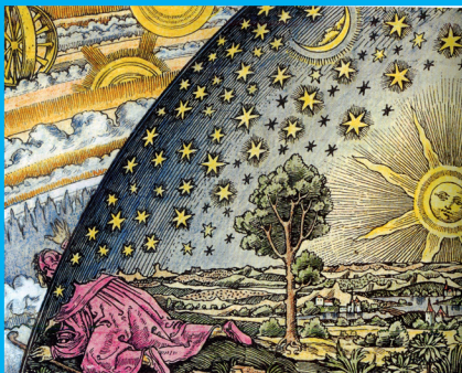
Weltbild im Wandel