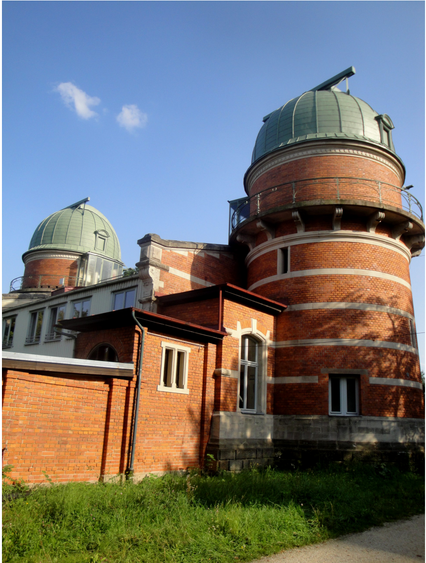
Abbildung 0.1: Kuppeln der Dr. Karl Remeis-Sternwarte Bamberg