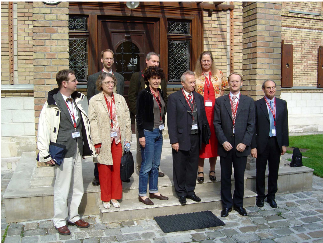
Abbildung 0.2: Vortragende der Tagung in der Kuffner-Sternwarte in Wien, 7.-9. Oktober 2004