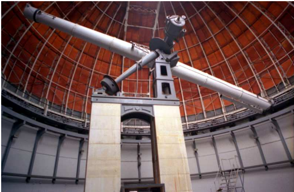
Abbildung 0.1: Sternwarte Nizza mit Großem Refraktor, gestiftet 1887 von Raphaël Bischoffsheim (1823–1906)