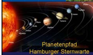
Planetenpfad Hamburger Sternwarte