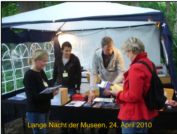
Lange Nacht der Museen, 24. April 2010