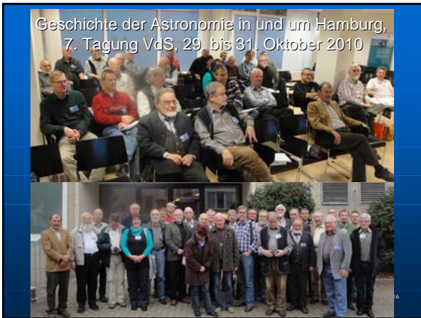
Geschichte der Astronomie in und um Hamburg, 7. Tagung VdS, 29. bis 31. Oktober 2010