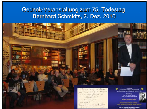
Gedenk-Veranstaltung zum 75. Todestag Bernhard Schmidts, 2. Dez. 2010