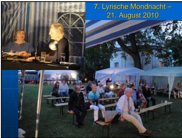
7. Lyrische Mondnacht – 21. August 2010