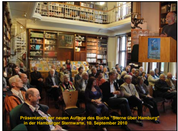
Präsentation der neuen Auflage des Buchs "Sterne über Hamburg" in der Hamburger Sternwarte, 10. September 2010