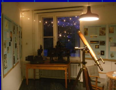
Ausstellung „Weltbild im Wandel“

„Sterne über Hamburg“, Poster-Ausstellung im Hauptgebäude