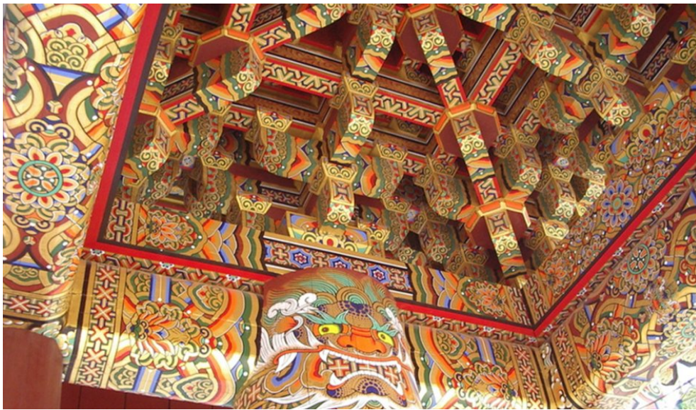
Farbig dekoriertes koreanisches Tempel

Seit der Antike schätzt unser Volk besonders die weisse Kleidung. Deshalb nennt man Korea das Volk, das weisse Kleider trägt. Weißes Licht vereinigt alle Farben. Unser Volk, das die Sonne und den Himmel hochschätzt, hat versucht, das weiße Licht im täglichen Leben wieder aufleben zu lassen. Die Spuren, die Koreaner an diesen weißen Gewändern lieben, werden gut dargestellt, zum Beispiel, Baby-Kleidung und Windeln, Bauernkleidung, Frugal Gelehrtenkleidung, die alten weissen Uniformen bei speziellen Ritualen oder Zeremonien sowie Trauerkleidung. Die weisse Kleidung bei uns bedeutet, dass Koreaner den Himmel und die Natur lieben. Und in der weissen Kleidung stecken die Träume, die Weltansicht und ein schönes Temperament von allen Koreanern, wie Respekt, Reinheit, Heiligkeit, Göttlichkeit, Frieden, Tod und Unsterblichkeit.