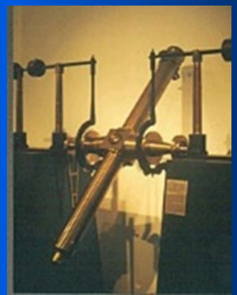
Repsolds Passageinstrument (heute in Kassel,)

Johann Georg Repsold (1770-1830) erhielt seine Ausbildung in Deichbau, Feinmechanik und Vermessungstechnik in Cuxhaven-Ritzebüttel. 1798 wurde er Spritzenmeister, 1809 Oberspritzenmeister des Hamburger Löschwesens. 1799 gründete er eine Werkstatt für astronomische Instrumente am Herrengaben, deren Präzisionsinstrumente zu den besten der Zeit zählten. 1802 errichtete er seine erste Sternwarte auf der Bastion Albertus, heute Stintfang. In diesem Zusammenhang entwickelte er das erste Meridianinstrument in Deutschland (1803). Er kooperierte mit Schumacher und Gauß bzgl. der Vermessung von Dänemark, Hamburg und Königreich Hannover (ab 1820). Nachdem 1812 seine Sternwarte in der Napoleonischen Zeit abgerissen werden musste, dauerte es bis 1825, als seine neue Sternwarte mit Navigationsschule auf der Bastion Henricus beim Millerntor erbaut werden konnte (heute Museum für Hamburgische Geschichte). Die Sternwarte am Millerntor wurde Staatsinstitut (1833). J.G. Repsold hatte die Grundlage für die Hamburger Sternwarte gelegt, die 1906/12 in Bergedorf neu errichtet wurde. Die Firma wurde unter dem Namen Adolf & Georg Repsold (1830-1867) und als A. Repsold & Söhne (1867-1919) weitergeführt und lieferte astronomische Instrumente an Sternwarten in aller Welt - ein Global Player.