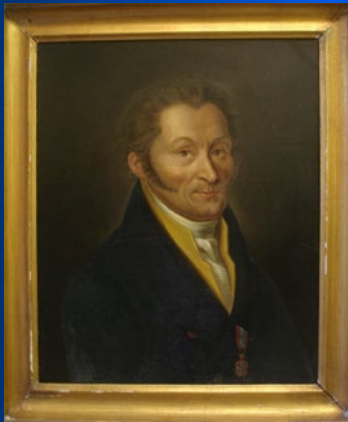
Portrait Johann Georg Repsold (Sammlungen GNT,)